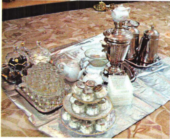
أدوات طبخ الشاي